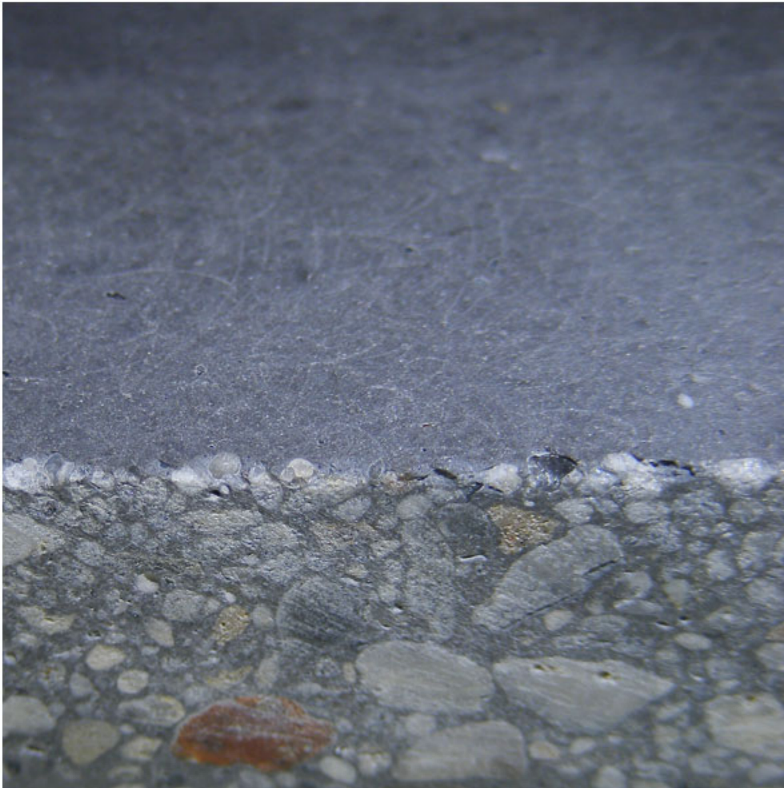
Schnitt durch eine Betonplatte

Beton wird aus Wasser, Zement und Gesteinskörnungen hergestellt. Bei unserem Sichtbeton gibt die äußerste Zementsteinschicht die farbliche Wirkung. Wird der Betonstein geschnitten oder stark geschliffen, werden die verschiedenen Gesteinskörnungen sichtbar.